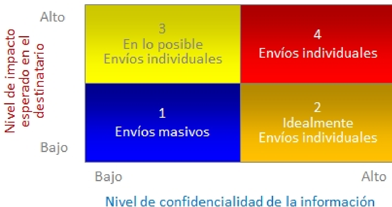
Figura 1. Matriz de Decisión de Envío de Correos a Grupos de Destinatarios

Llevo ya algunos años analizando las características de los envíos grupales, habiendo interactuado con profesionales de distintos rubros, en varios países y creo que son dos los factores principales que determinan si un envío debe ser masivo o individual: el nivel de confidencialidad de la información y el nivel de impacto esperado en el destinatario.